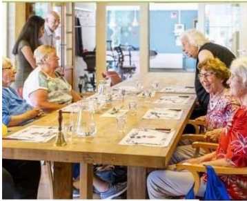
De Weldam, De Gaanderij en De Petersborg heten je van harte welkom om één of meerdere dagen in de week aan ons te komen.